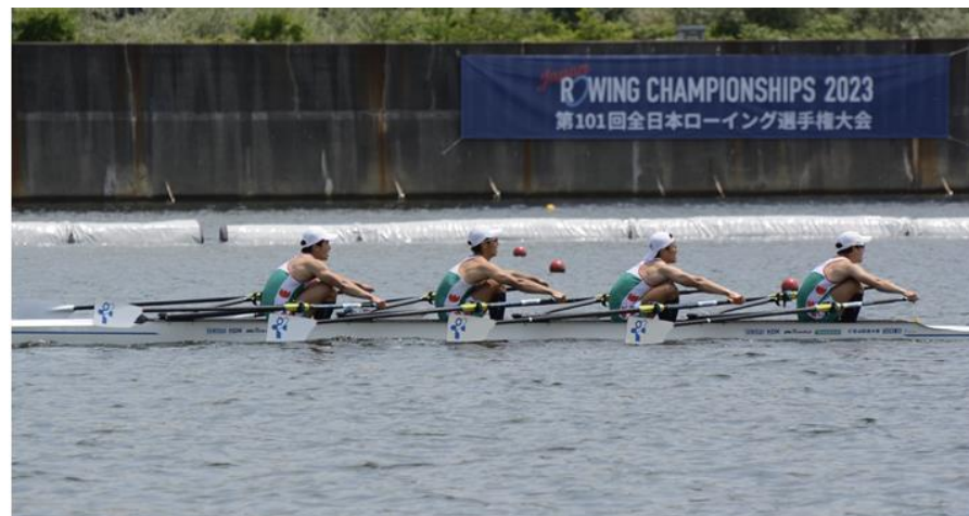
男子クォドルプル優勝(2023)