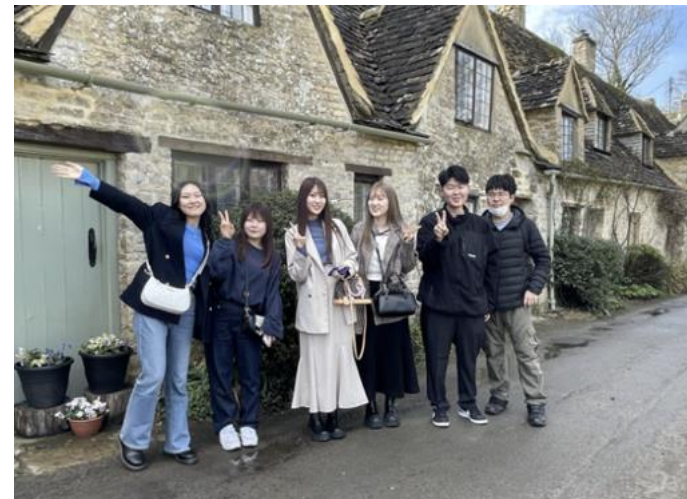
ロンドンでの建築・住宅史研修