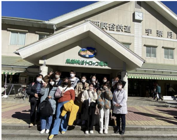
留学生の異文化研修 (黒部溪谷)