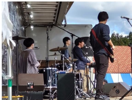
軽快な音楽で会場を盛り上げた軽音学部の演奏