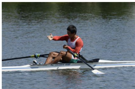
男子シングルスカル優勝 (2022)

男子シングルスカル優勝、男子ダブルスカル準優勝、 男子ペア・男子クォドルプル3位。