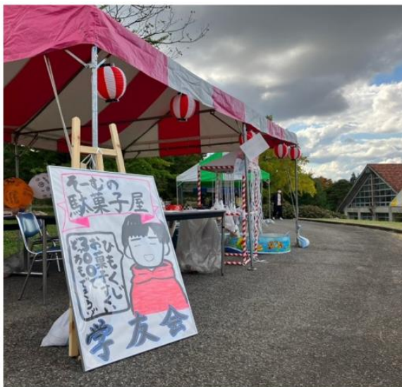
模擬店コンテスト1位となった「総務の駄菓子屋」(看板がいいですねえ。ちなみにこれを書いている人がモデルです。)