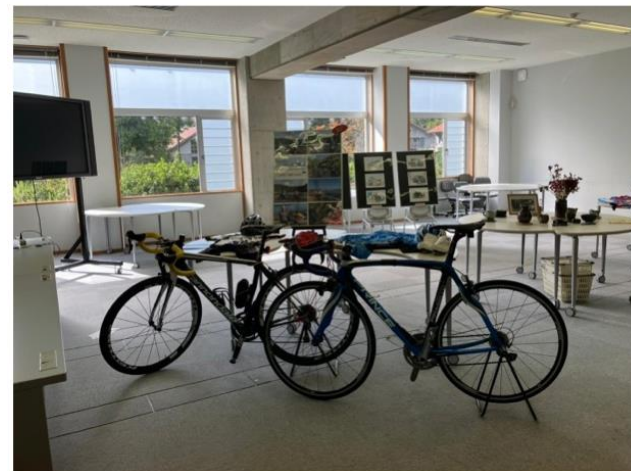
普段とは違う先生方の一面が垣間見られた教職員の趣味の部屋